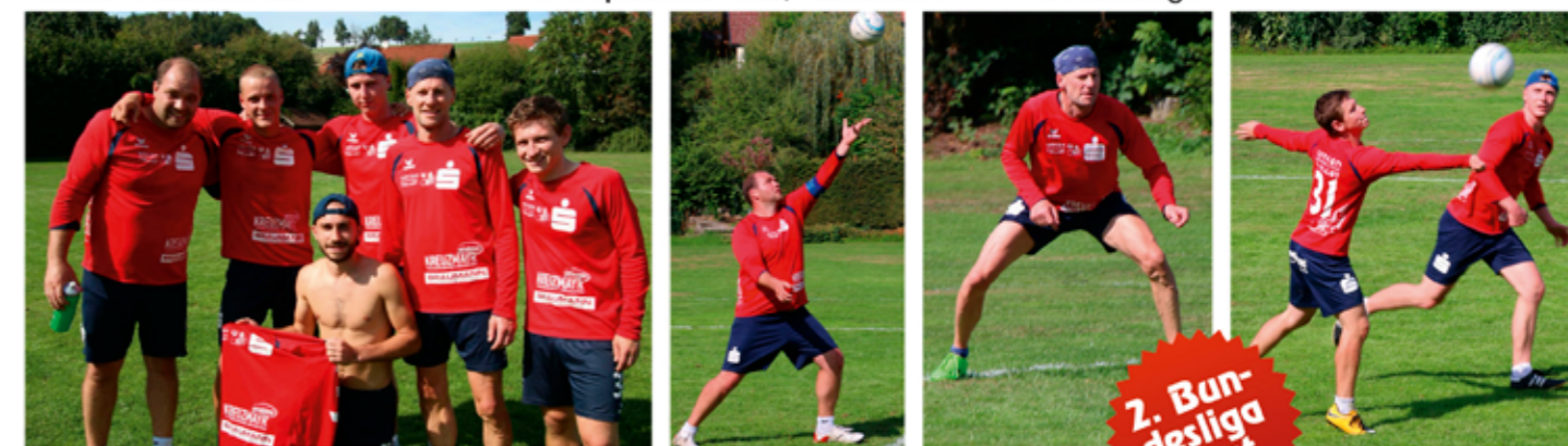
Ein paar Eindrücke aus der Heimrunde in Tollet.