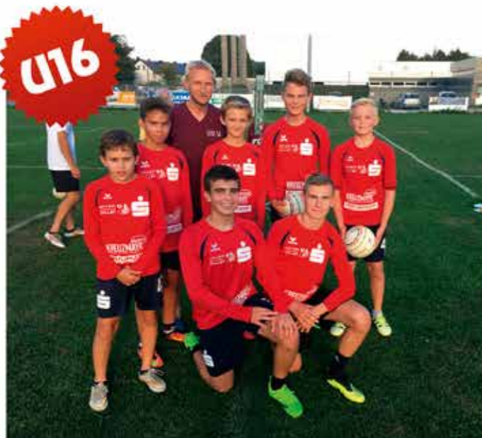
Die Mannschaft der U16 hat am 21.9. in Grieskirchen knapp verloren, aber gut gespielt. Wir drücken euch die Daumen für das nächste Mal.