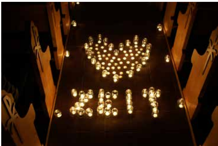
Am 31.10.2016 luden wir zur „Nacht der 1000 Lichter“ unter dem Motto eine „Auszeit vom Alltag“ in die Kirche nach Oberwödling.

Beeindruckend waren die vielen Kerzenlichter, welche den Besuchern das Herz erwärmte. Viele nutzten diese Gelegenheit auch für persönliche Gebete, verweilten in der Kirche und genossen leise Musik. Im Außenbereich erstrahlten nicht nur die Kerzen, sondern ein sternklarer Abend machte die Nacht der 1000 Lichter perfekt.