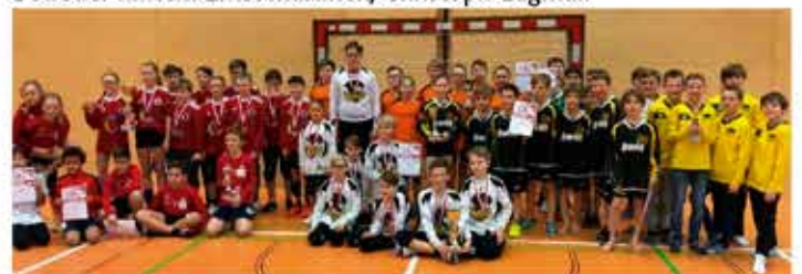
U12 Landesmeisterschaft Wir gratulieren unserer Mannschaft zum Einzug in die Landesmeis- terschaft. Mit 0/2 (13:22) mussten sie sich der Union Nußbach im Endspiel geschlagen geben und platzierten sich am 8. Platz.